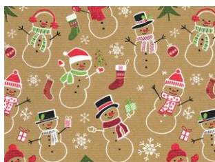
Y33-28402 (nur 70cm)